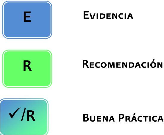
Tabla de referencia de símbolos empleados en esta guía

Los sistemas para clasificar la calidad de la evidencia y la fuerza de las recomendaciones se describen en el Anexo 6.2.