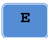
Tabla de referencia de símbolos empleados en esta Guía:

Los niveles de las evidencias y la graduación de las recomendaciones se mantienen respetando la fuente original consultada citando entre paréntesis su significado. Las evidencias se clasifican de forma numérica y las recomendaciones con letras; ambas, en orden decreciente de acuerdo a su fortaleza.